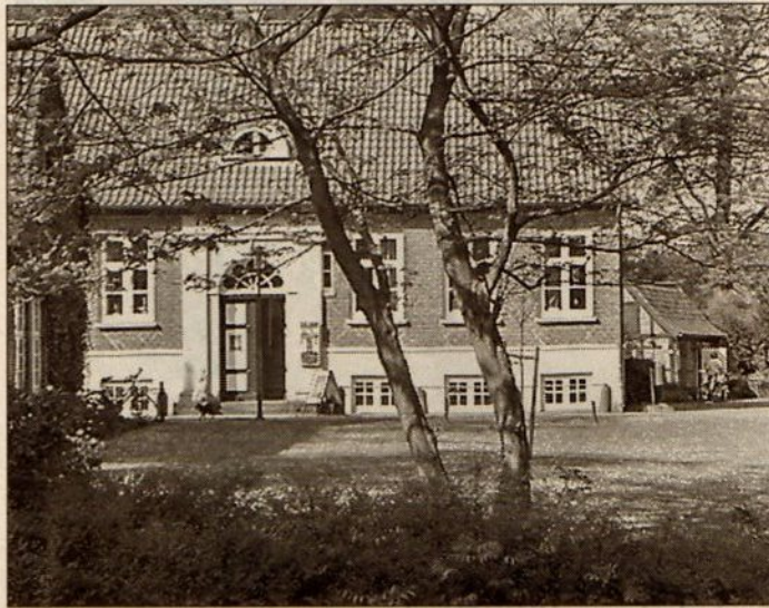
Ein idyllischer Blick auf das Gerichtsschreiberhaus auf der Barmstedter Schlossinsel. Hier befindet sich die Galerie/Atelier III.

Die interessanten Exponate aufgestellt auf der gesamten Schlossinsel, bieten ein breites künstlerisches Spektrum. Sie wurden aus Marmor, Granit,